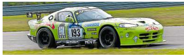
Der Dodge Viperer ist morgen zum Anfassen da.